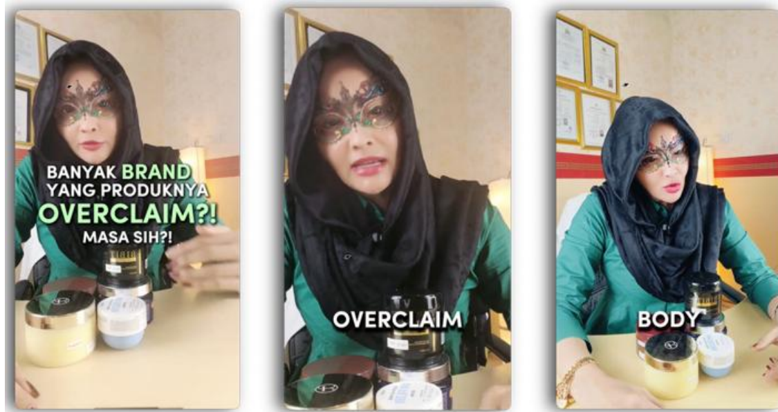
Gambar 2. Tangkapan Layar dari Video 2 pada akun Tiktok @dokterdetektif

tepat. Tema ini juga mencakup transparansi label produk dan wawasan ilmiah mengenai bahan-bahan kosmetik yang dapat mempengaruhi kesehatan kulit.