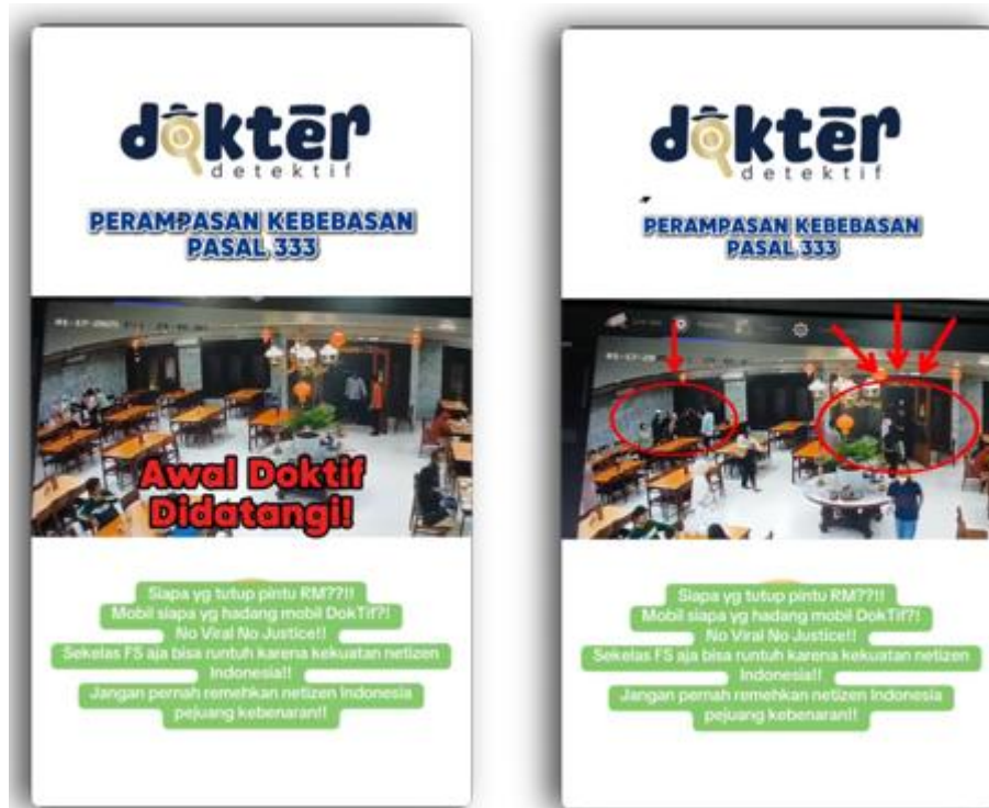
Gambar 4. Tangkapan Layar dari Video 4 pada akun Tiktok @dokterdetektif

praktik ilegal di industri perawatan kulit dan mendorong tindakan kolektif demi keselamatan pengguna. Sosok “dokterdetektif” ditampilkan sebagai figur pahlawan netizen yang melindungi publik serta mengedukasi audiens tentang produk yang aman dan yang patut dihindari. Gambar 4 merekam inti pesan tersebut: kolaborasi warga digital yang sigap membongkar kecurangan dan menjaga kepentingan masyarakat luas.