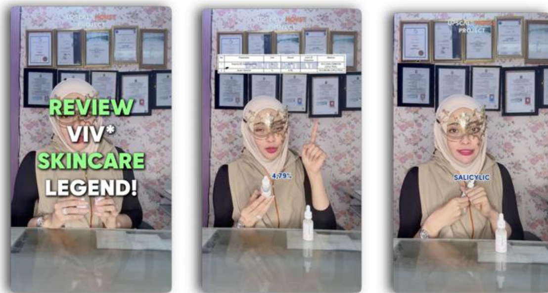
Gambar 1. Tangkapan Layar dari Video 1 pada akun Tiktok @dokterdetektif

Video 1 (tangkapan pada Gambar 1) membahas dua produk serum yang sudah dikenal di pasaran, yaitu EGNE Serum dan Glowing White Serum. Keduanya mengklaim mengandung niacinamide, salicylic acid, dan licorice dengan harga sangat terjangkau, sekitar Rp20.000–Rp22.000. Hasil uji laboratorium yang dipaparkan dalam Video 1 memverifikasi klaim pada kemasan: EGNE Serum yang mencantumkan 4% niacinamide dan 1% salicylic acid terukur mengandung 4,79% niacinamide dan 0,96% salicylic acid; sementara Glowing White Serum yang mengklaim 5% niacinamide terdeteksi mengandung 5,49% niacinamide. Temuan tersebut menegaskan bahwa, meskipun berharga ekonomis, komposisi kedua produk konsisten dengan klaimnya.