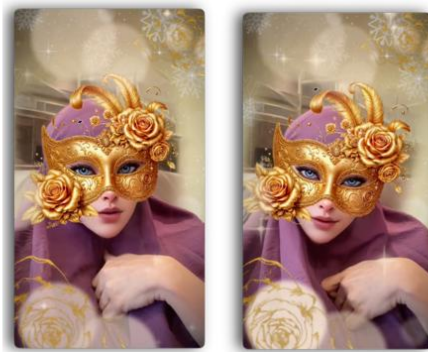
Gambar 3. Tangkapan Layar dari Video 3 pada akun Tiktok @dokterdetektif

Video 3 (tangkapan Gambar 3) menampilkan pernyataan klarifikasi terkait dugaan fitnah. Seorang perempuan bertopeng menyanggah tuduhan yang diarahkan kepadanya dan menegaskan tidak memiliki keterlibatan dalam aksi oknum berinisial DRL dan SS yang dikaitkan dengan pihak HS. Fokus utama bertumpu pada nilai kebenaran dan integritas pribadi, sekaligus ajakan untuk mengandalkan mekanisme hukum sebagai jalur penyelesaian.