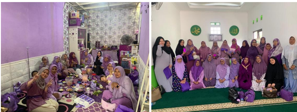
Gambar 2. Kegiatan para anggota Purple Lovers Community

Dalam proses penerimaan anggota baru, Purple Lovers Community sepakat untuk tidak mengadakan open recruitment atau kegiatan serupa. Komunitas ini membuka peluang sepanjang waktu bagi calon anggota yang ingin bergabung. Namun, terdapat beberapa tahapan dan peraturan yang harus dipenuhi oleh calon anggota baru, antara lain: 1) Calon anggota wajib memiliki akun Instagram dengan konten yang didominasi oleh warna ungu; 2) Akun Instagram calon anggota tidak boleh diatur sebagai akun privat; 3) Calon anggota diwajibkan untuk mengikuti tantangan dari Purple Lovers Community selama dua bulan berturut-turut; 4) Anggota lama diwajibkan mengikuti tantangan minimal dua kali dalam sebulan; 5) Semua anggota harus menaati peraturan komunitas yang telah ditetapkan. Selain itu, 'Miss Purple' makna simbolik yang diartikan sebagai otoritas dalam komunitas, berhak mengeluarkan anggota yang dianggap meresahkan, memprovokasi, atau membuat situasi grup menjadi tidak kondusif. Hal ini menunjukkan bahwa Purple Lovers Community adalah komunitas yang terstruktur dengan baik, di mana anggota setuju untuk tidak menerima sembarang orang agar menjaga kualitas dan kenyamanan interaksi dalam komunitas. Gambar 2 menunjukkan kegiatan para anggota Purple Lovers Community.