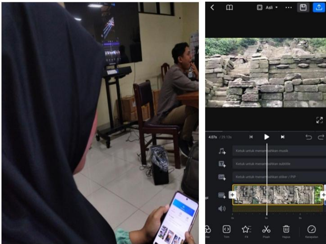
Gambar 4. Materi Praktik Pembuatan Videografi